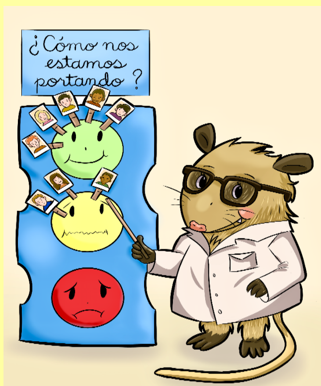
Elaboración propia con el programa asistido ibis Paint X