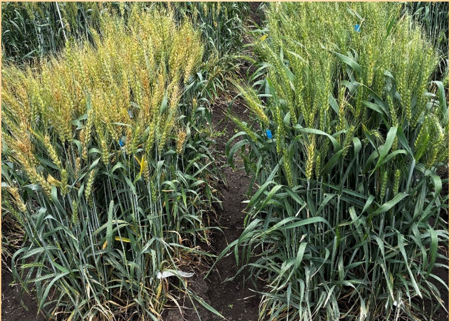
Figura 3. Comparación en campo entre una variedad de trigo susceptible (izquierda) y una variedad resistente (derecha) a la fusariosis de la espiga. La variedad susceptible muestra mayor decoloración y daño en las espigas, mientras que la variedad resistente mantiene una apariencia más uniforme y saludable.

No se trata de crear un trigo “invulnerable”, porque hasta ahora no existe inmunidad total, sino de desarrollar