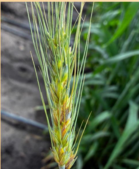
Figura 1. Síntomas típicos de la fusariosis de la espiga en trigo.

Hablar de fusariosis no es hablar solo de una enfermedad de un cultivo. Es hablar de la inocuidad de nuestros alimentos y de la fragilidad de un sistema que comienza, silenciosamente, en cada espiga.